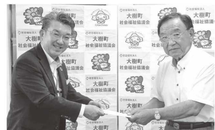
帯広信用金庫大樹支店様

あたたかいご寄付をありがとうございます (令和5年5月1日～令和5年8月22日)