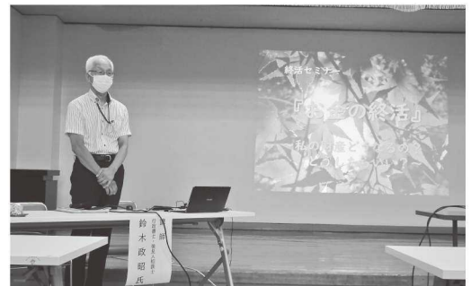
『お金の終活』相続や遺言の基本を真剣にメモ!