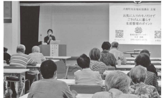
『生前整理のポイント』クイズ形式で楽しく♪

受付開始直後から沢山の皆様から申し込みがあり、全コース20名～30名以上の方が受講され、関心の高さが伺えました。今回はより「実践的」なお話や、講師の皆様が実際に体験した事例を元にお話いただき、参加者の皆様から大変好評でした。セミナーでは共通して、終活は、これからの人生を「安心して」「楽しく」「いきいき」暮らすための方法で、今から家族と話し合っておきましょうとお話がありました。