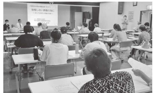
『葬儀の知識』沢山の事例で分かりやすく!