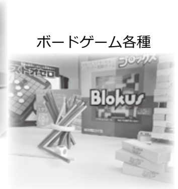
ボードゲーム各種